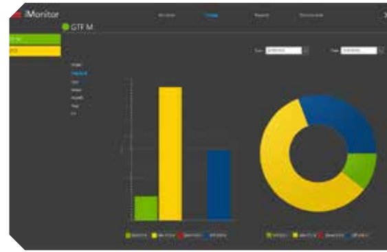
Stati di funzionamento della macchina: tempi totali in un periodo di tempo definito dall'operatore

I dati di una singola macchina possono essere visualizzati direttamente sullo schermo del controllo, mentre su uno o più PC in azienda possono essere raccolti e visualizzati i dati di tutte le macchine collegate.